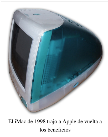
El iMac de 1998 trajo a Apple de vuelta a los beneficios

Debido al crecimiento en ventas de los clones de IBM en los años 1990, éstos se convirtieron en el estándar para los usos en los negocios y el hogar. Este crecimiento fue aumentado por la introducción del sistema operativo Microsoft Windows 3.0 en 1990, y seguido por los sistemas operativos Windows 3.1 en 1992 y Windows 95 en 1995. El Macintosh fue enviado a un período de declinación a mediados de los años 1990, y por 1996, Apple casi estaba en bancarrota. Steve Jobs retornó a Apple en 1997 y llevó a Apple de vuelta a la rentabilidad, primeramente con el lanzamiento del Mac OS 8, un nuevo sistema operativo para los computadores Macintosh, y con los computadores PowerMac G3 y el iMac para los mercados profesional y hogareño. El iMac fue notable por su carcasa azul de cuerpo transparente en una forma ergonómica, así como por descartar dispositivos heredados como el disco floppy y los puertos seriales en favor de la conectividad Ethernet y USB. El iMac vendió varios millones de unidades y un modelo